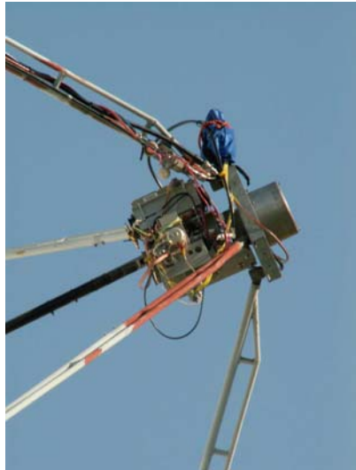
73 Tonda za OK1KIR

17.6.2007 0905 LX1DB 579/579 17.6.2007 1710 VE4MA O/O 18.6.2007 0645 VK3NX O/M 73! Franta OK1CA Takže tolik od prvního z účastníků této vydařené akce. Od Tondy OK1DAI z OK1KIR klubu přišla informace k opakovanému EME víkendu v pásmu 3,4 GHz. Druhý 9 cm EME test 14./15.7.2007 v OK1KIR. Po opravení a dodělání toho co se v prvním testu v červnu nestihlo jsme v nesnesitelném vedru absolvovali druhé kolo. Sobota 14.7. 09,39 G3LTF 549/549 a G4NNS 539/549 # 3. Byly udělané polarizační testy nejprve s G4NNS linear – linear. Potom s G3LTF cirkulár – linear. Neděle 15.7. 04,27 VK3NX 549/539 # 4 a nový OK ODX 15888 km. 08,01 LX1DB 559/559 #5, 08,08 G3LTF 559/549, 09,47 G4NNS 549/539, 15,38 VE4MA O/O sri ncm, 16,20 W5LUA #6 a 17,43 N9JIM 569/O # 7. Poslouchali jsme G3LQR O - pro poruchu přehřátého zařízení nedošlo k pokusům o spojení. Po vychlazení zařízení v buňce, kde bylo přes 40°C již Simon neměl okno. Na fotce je lineární zářič (upravený z původního radaru), anténní přepínač, PA a LNA v ohnisku. Při polarizačních testech se vše pootáčí po 10°.