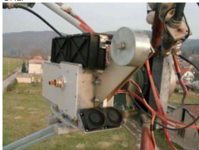
pohled na TRV včetně TWT PA v ohnisku

Během víkendu 8.- 9.3. jsme v našem EME deníku založili stránku pro osmé pásmo. Po sobotních úspěšných testech šumů a vlastních odrazů jsme očekávali, že se v neděli povede udělat nějaké spojení. Dopadlo to takhle: DF1OI O/O, DK7LJ O/O, LX1DB 449/449, W5LUA 549/449, VE4MA O/O Naše signály poslouchal ještě PA0EHG . Použili jsme toto zařízení 4,5 m parabola s lineární otočnou polarizací, DB6NT LNA s WG vstupem a asi 20 W výkonu z TWT v zářiči. V neděli byl šum slunce 14,8 dB a šum měsíce 1,9 dB. Přikládám fotky z ohniska antény s transvertorem pro 24 GHz.