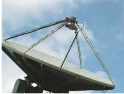
Celkový pohled na parabolu s TRV

Škoda, že bylo tolik oblačnosti to užíralo signály, viz známe grafy, kde voda má na 24 GHz ostré maximum. Předtím, když bylo jasno jsme měli šum Měsíce až 2,4 dB včera jenom 1,9 dB.