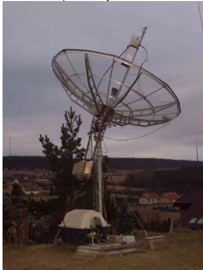
Parabola 2,4m a PA v boudě

Co dodat, nezbyvá než pogratulovat k velkému úspěchu. Jak jsem již uvedl výše, spojení s LX1DB a VE4MA kluci rozšířili sbírku DXCC v pásmu 24 GHz o Lucembursko a Kanadu, rovněž spojení s W5LUA je novým ODX pro OK v pásmu 24 GHz. Doufám, že se mi podaří kluky z OK1KIR přemluvit k prezentaci tohoto úspěchu na EME a MW semináři, který proběhne tento rok v květnu na Třech Studních. Velmi dobře se mi píše informace o další aktivní stanici EME v OK. Prvním spojením JT65c s G4CCH a druhým spojením CW s OK1DFC na pásmo 23cm přišel Saša OK1DST . Saša používá parabolu o průměru 2,4m a PA s výkonem okolo 100W. Jak se říká s „jídlem roste chuť“ Saša pracuje na dalším vylepšení zařízení a je předpoklad že se brzy objeví na pásmu aktivněji. Obrázek jeho antény a PA umístěného v psí boudě je zde: